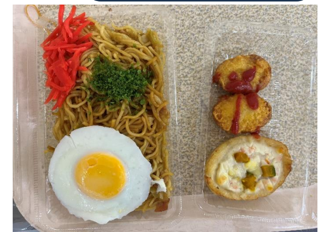
○お祭りメニュー○ ・焼きそば 目玉焼き 乗せ ・ナゲット ・グラタン