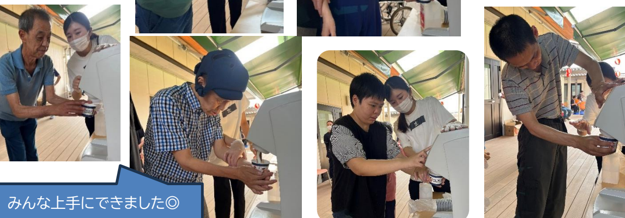
みんな上手にできました◎